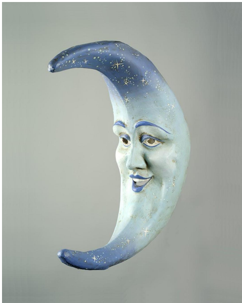
Luna Deco Gocce © Olivier Desart – MUMASK

Au cœur de ces rituels masqués, les animaux se présentent comme une source d'inspiration inépuisable. De par leur rapport étroit avec la nature, ils apparaissent souvent comme des intermédiaires privilégiés avec les forces naturelles et surnaturelles. Dans certaines sociétés, ils peuvent devenir l'objet d'une vénération ou servir de représentation aux divinités ou aux concepts sacrés. Dans d'autres contextes rituels, particulièrement dans les communautés dépendantes de l'élevage, cette célébration mystique de l'animal laisse place à la démonstration d'un rapport de force entre l'humanité et la bestialité. Dans ces mascarades, l'homme impose sa domination sur les bêtes, mais espère donc aussi étendre son emprise sur son environnement.