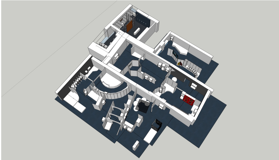
Maquette 3D de "Regards sur les collections"