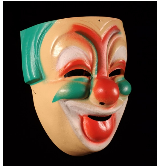
Masque facial de clown © Olivier Desart - MUMASK

Le masque continue d'inspirer les sociétés modernes et s'intègre notamment dans la culture de masse, à travers diverses œuvres fictionnelles. Le potentiel symbolique du masque n'a pas manqué d'inspirer les auteurs et les artistes. Peu importe le support, l'apparition d'une personne masquée à l'écran, dans les pages d'un ouvrage ou lors d'un concert, ne laisse jamais indifférent. Le masque s'est donc peu à peu imposé comme un immanquable dans la culture populaire.