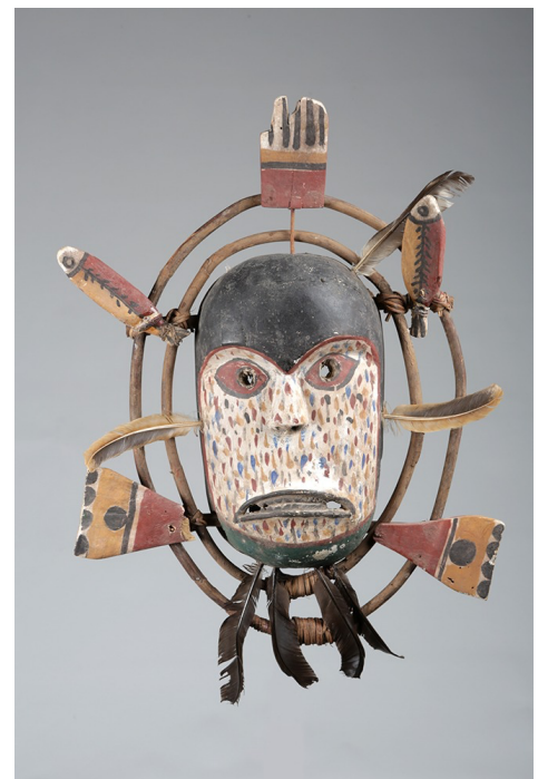
Divinité de la pluie

Dépendant de son environnement pour subvenir à ses besoins, l'être humain cherche régulièrement des solutions rituelles face aux aléas de la nature. Afin d'assurer sa survie, on retrouve à travers toutes les régions du monde une série de rites où les masques servent d'agents propitiatoires , c'est-à-dire d'intermédiaires permettant de rendre les divinités ou les forces de la nature favorables aux demandes des hommes.