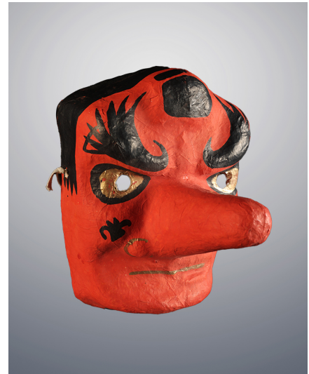
Saruta Hiko

Dans de nombreuses communautés, le mariage est également un moment important de l'existence, indispensable pour être considéré comme un membre accompli de la société. De nombreuses traditions masquées encadrent ce passage vers le mariage. L'accès à certains masques est d'ailleurs parfois réservé à des personnes mariées ou, à l'inverse, à des personnes non mariées. En dehors des célébrations, le masque peut également servir de marqueur visuel pour indiquer le statut marital d'un individu, avant ou après un engagement.