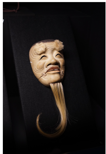
Masque facial d'Okina

En Italie, les pratiques masquées sont également très populaires et s'expriment de manière particulièrement fastueuse et colorée dans le carnaval de Venise. Toutefois, le port du masque ne se réduit pas uniquement à la période du carnaval. Très apprécié au XVII e et XVIII e siècle, il est porté à diverses occasions ainsi que dans plusieurs sphères de la vie culturelle italienne, comme à l' opéra , lors de bals populaires ou sur les planches de théâtre .