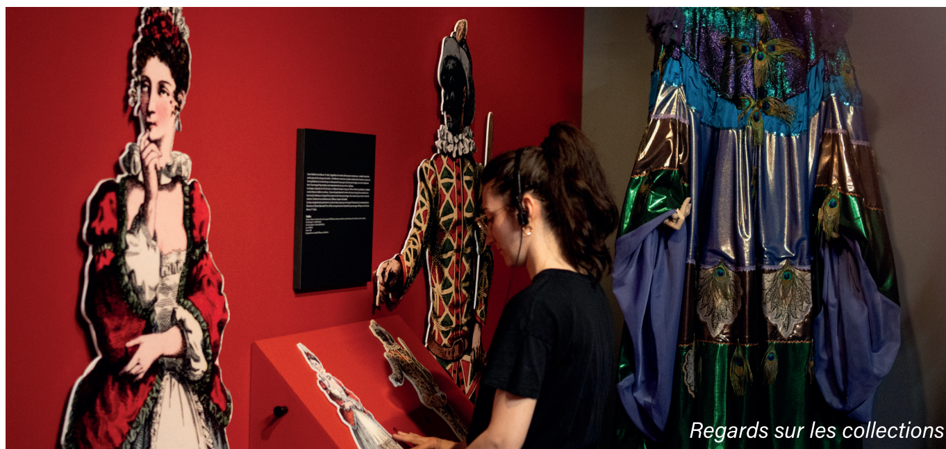
Regards sur les collections

C'est tout naturellement que POPulaire. Fêtes de Belgique s'inscrit dans la continuité de Regards sur les collections .